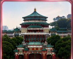
ศาลาประชาม (ชมด้านนอก)