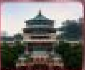
ชมเมืองฉงชิ่งจากหอประชุม