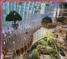
ห้างการค้าเดินที่กว้างหวน