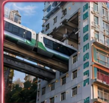
นั่งรถไฟทะลุติ๊ก 2 สถานี