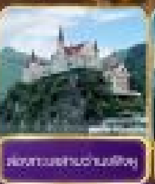
ล่องแพผิงชานผิง