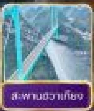
สะพานฉางก๊วย