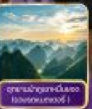
อุทยานป่าภูเขามันหยอด Manyan Mountain Park

เมนูพิเศษ !! ปลาเผิงเวินผิง สุกี๊ต นมสังขยาหม่า