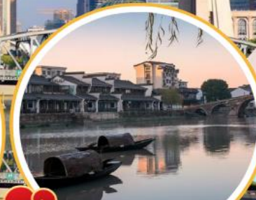
เมืองโบราณถงฉี