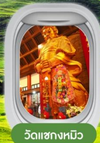
วัดชางหมีว