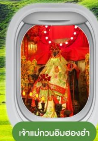
เจ้าแม่กวนอิมฮองฮ่า