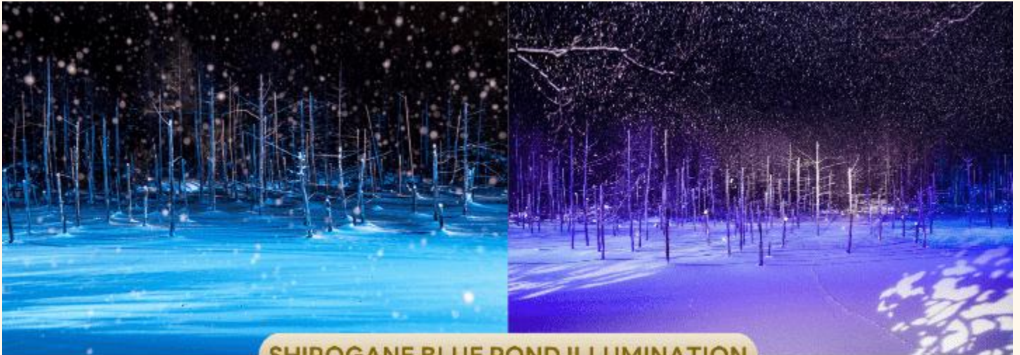
SHIROGANE BLUE POND ILLUMINATION