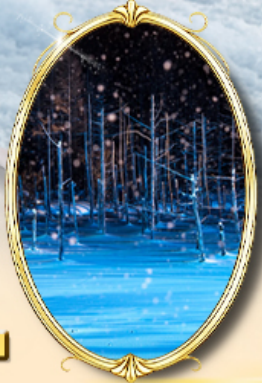
Shiragane Blue Pond Illumination