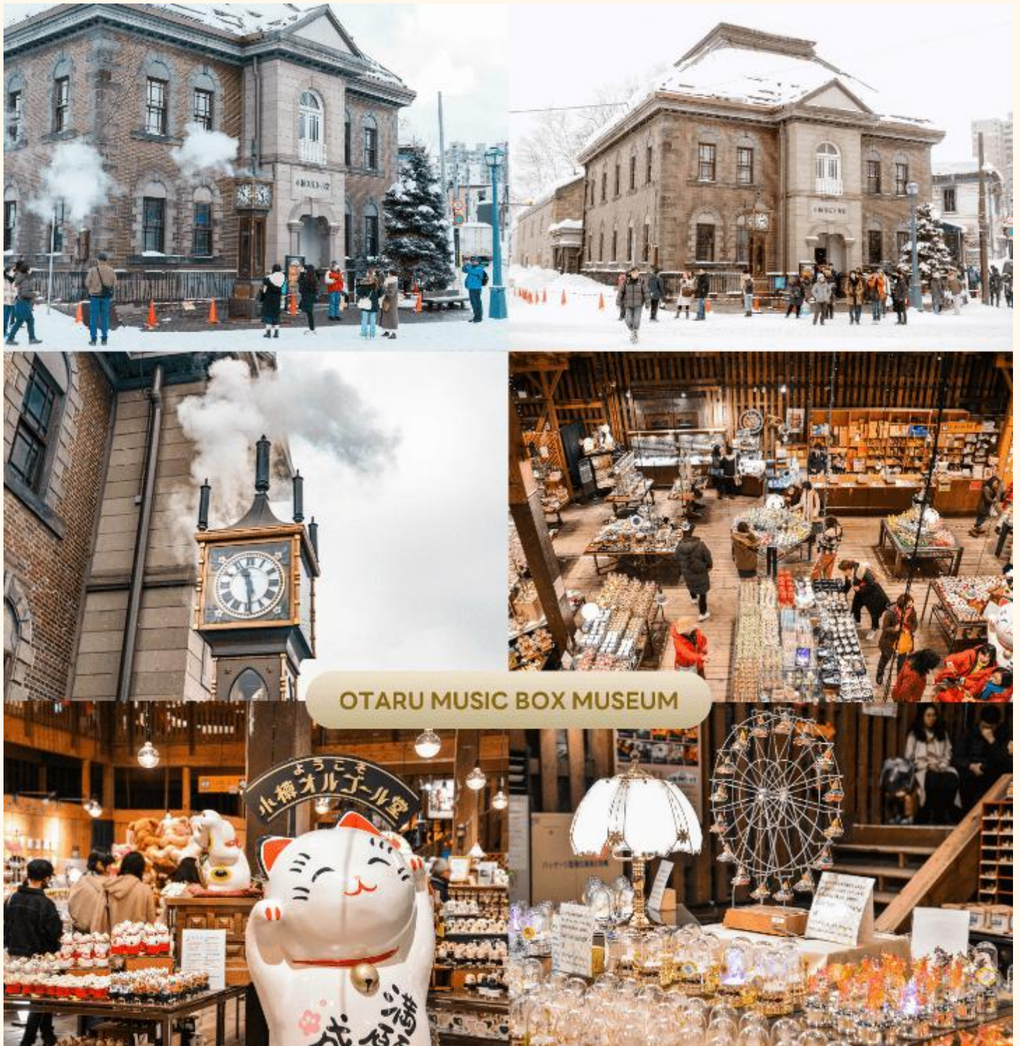
OTARU MUSIC BOX MUSEUM

จากนั้นนำท่านสู่ ร้านขนม LeTAO ร้านขนมหวานชื่อดังของเมืองโอตารุ (Otaru) จังหวัดฮอกไกโด จุดแข็งของ LeTAO คือการเลือกใช้เฉพาะวัตถุดิบชั้นเลิศจากฮอกไกโดเท่านั้น ทั้งนม เนย แป้ง ครีมสด และผลไม้ต่างๆ เมื่อรวมกับฝีมือของ พาทิซิเยอร์และเทคโนโลยีระดับโปรแล้ว ทำให้สามารถรักษาความอร่อย ความเข้มข้นหอมมันของชีสเค้ก Fromage Double ได้เป็นอย่างดี (ราคาทัวร์ไม่รวมค่าอาหาร และเครื่องดื่ม)