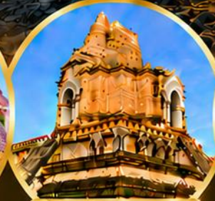
วัดเจดีย์หลวงวรวิหาร