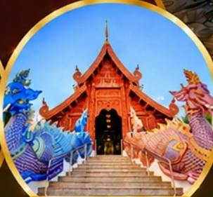
วัดเด่นสะหีศรีเมืองแกม