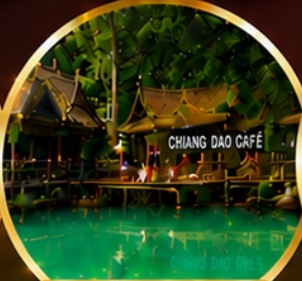
ท่าเชียงดาว