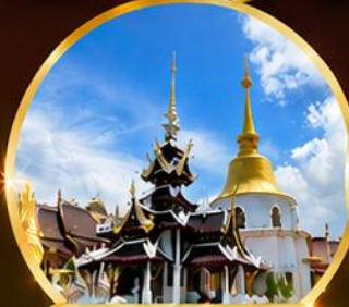
วัดป่าดาราภิรมย์