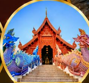
วัดต้นสะหลิ่งศรีเมืองแก่น