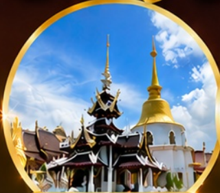
วัดป่าดาราภิรมย์