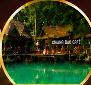
ท่าช้างผดุง