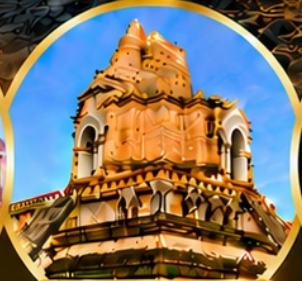
วัดเจดีย์หลวงวรวิหาร