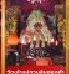
San Tin Hau Shrine