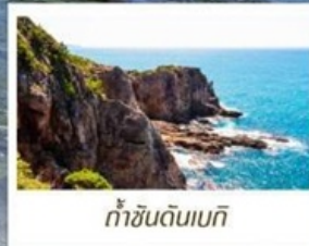
ท้ำซันดินเบกิ