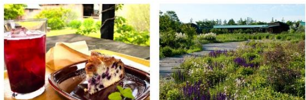
รับประทานอาหารค่ำ ภายในโรงแรม