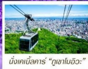
นั่งเคเบิลคาร์ "ภูเขาโมอิวะ"