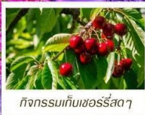
กิจกรรมเก็บเชอร์รี่สดๆ