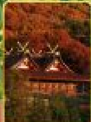
วิวสวยจากเกาะบะทอก