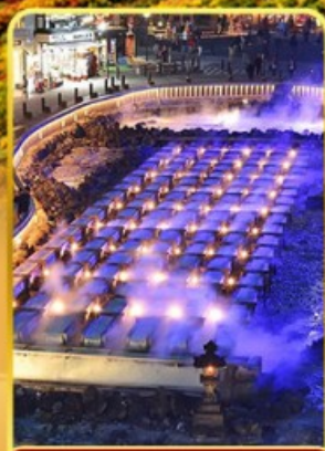
ชมยูบาตากะ