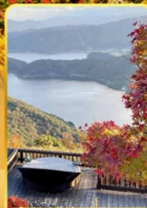
จุดชมวิวกะเอสซามินิกาดะ