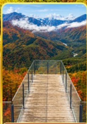
อาคุบะอิว่าตากะ