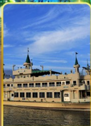
ล่องเรือทะเลสาบโทโยะ