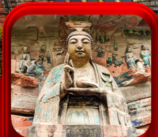
“ ผาหินแกะสลักต้าจู่ ”

บินตรงลงองซิ่ง • อู่หลง หลุมฟ้าสะพานสวรรค์ • ระเบียงแกว • อุทยานเขานางฟ้า หงหยาดัง • นั้งรถไฟทะลุตึก • ศาลาประชาม (ด้านนอก) • หลงหมินฮ่าว มรดกโลกผาหินแกะสลักต้าจู่ • วัดหลิวฮั่น • ตึกตะเกียบ • หมู่บ้านโบราณสี่ซีโจว