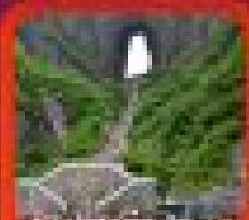
"ทางเดินชมทะเล"