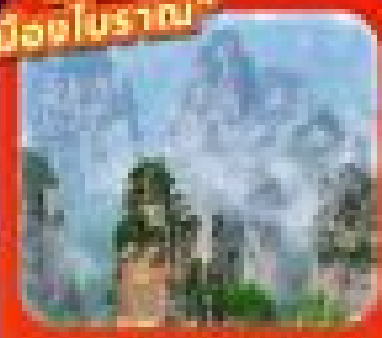
"อนุสาวรีย์ตงตง"