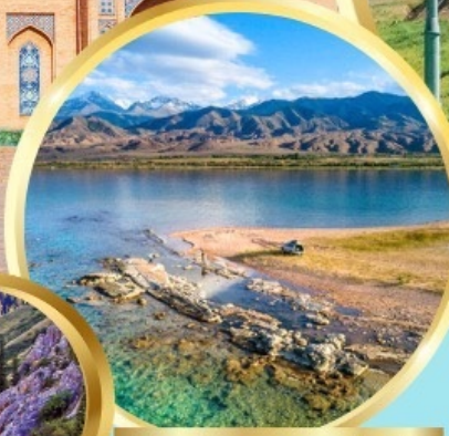
ล่องเรือทะเลสาบอิสซิค