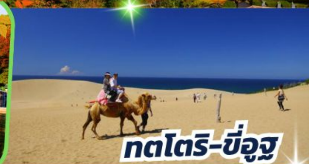
ทตโตริ-ซ็องจู