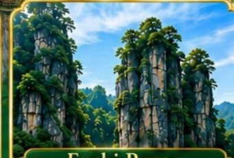
Enshi Puyan อุทยานหินเอนซือปูหย่า