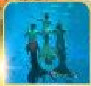
ตลิวเฮาส์