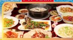
อาหารสตรีทกวางตุ้ง