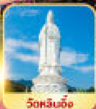
วัดหินขาว