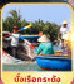
บั้งเรือกระซัง