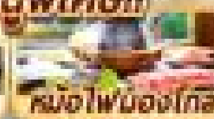
หม้อไฟบ๊องโก