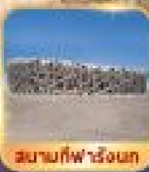
สนามกีฬาชิงกอก