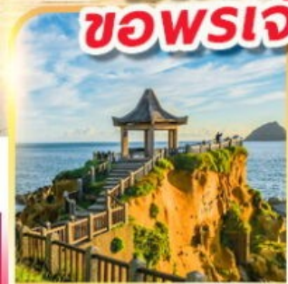
เกาะเหอฝิง

พักย่านซีเหมินติง 2 คืน ขอพรเจ้าแม่กวอนอัมพันมือ