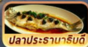
ปลาประดานาหรับดี