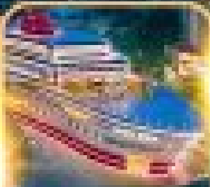
เรือ The LOUIS