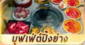
บุฟเฟ่ต์ปักกิ่งย่าง