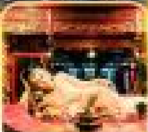
สัตว์หมักชาง