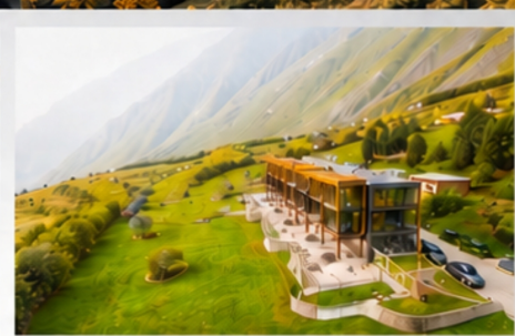
THE ROOM KAZBEGI HOTEL