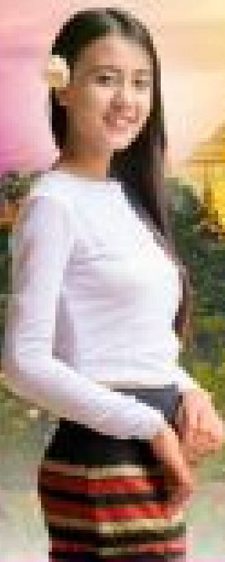
เจดีย์เอชพุกา