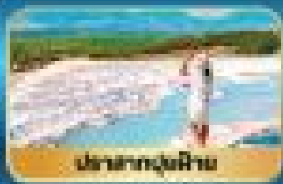
เล่นน้ำทะเลริมฝั่ง