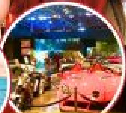
Norani Automobile Museum