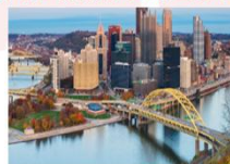
เมืองพิตส์เบิร์ก