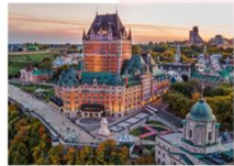
Fairmont Le Chateau Frontenac

** พักที่ Double Tree By Hilton Quebec Hotel 4* หรือเทียบเท่า **