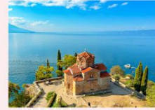
St. John at Kaneo Church ป้อมปราการซามูเอล