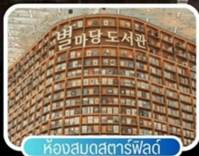
ห้องสมุดสตาร์ฟิลด์