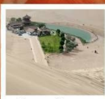
เป็นทรายหิมชซาซาน