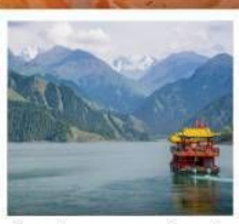
ช่องเรือทะเลสาบเทียนฉือ