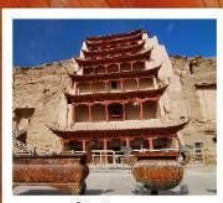
ถ้ำม้อเถา