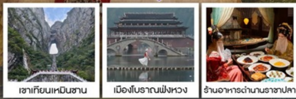
เขาคิยเหินชาน

พิเศษ!!...รอบค่ำเช้าชุดพื้นเมืองที่ฟ่งหวง • รอบค่ำช่างถ่ายรูป น้ำตกฟูหรง