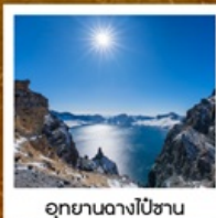
อุทยานอางโป่ซาน