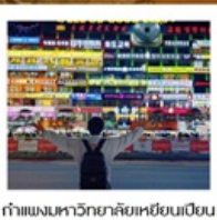
ก้าแพงมหาวิทยาลัยเหยียนเปียน