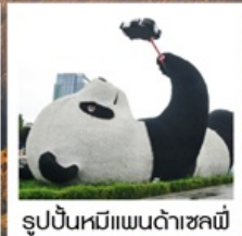
รูปปั้นหมีแพนด้าชหลี่