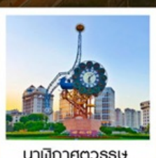
นาฬิกาตวอรรษ