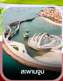
สะพานจูบ

✈️ คอนเฟิร์ม ออกเดินทาง ✈️ ทุกพีเรียด 2 ท่านขึ้นไป