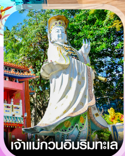
เจ้าแม่กวนอิมริมาทะเล