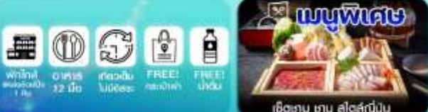
เช็ทซาบู ซาบู สไตล์ญี่ปุ่น