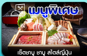
เชิ๊ดเตา ซาซู สีสันญี่ปุ่น