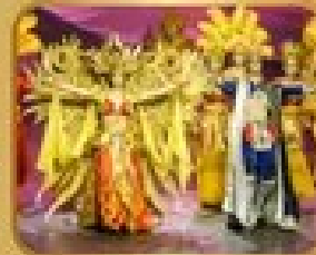
ชมการแสดงละครเวที