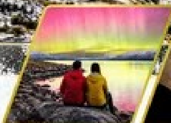
ตามล่าหาแสงใต้