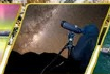
กิจกรรมชมทิวทัศน์ดาว