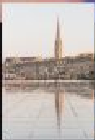
แคว้นลียง