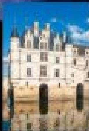
ปราสาทลูแวงส์