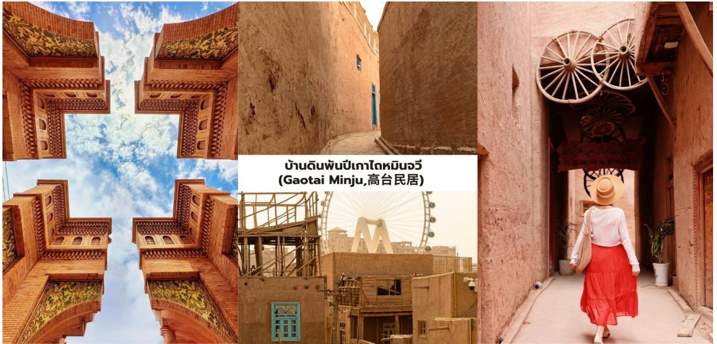
บ้านดินพันปีเกาโตหมินจวี่ (Gaotai Minju, 高台民居)

นำท่านชมด้านนอก มัสยิดอิคมาห์ (Id Kah Mosque, 艾提尕尔清真寺) ศูนย์รวมจิตใจและสัญลักษณ์ที่ยิ่งใหญ่ที่สุดของเมืองคัชการ์ที่เป็นหนึ่งในมัสยิดที่ใหญ่ที่สุดในประเทศจีนและเป็นสถาปัตยกรรมอิสลามสไตล์เอเชียกลางที่เก่าแก่กว่า 500 ปี (สร้างขึ้นในปี ค.ศ. 1442) ซึ่งยังคงเปี่ยมไปด้วยพลังแห่งศรัทธามาจนถึงทุกวันนี้