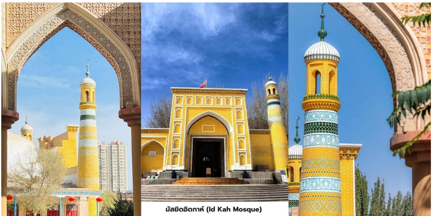
มัสยิดอิคกาห์ (Id Kah Mosque)

บ่าย จากนั้นนำท่านสู่ จุดลงทะเลเบียนขอบอนุญาตเดินทางผ่านเขตเมืองกาซเคอร์กันเป็นพื้นที่ซึ่งติดชายแดนปากีสถานและอัฟกานิสถาน นักท่องเที่ยวทุกท่านต้องมีใบอนุญาตเดินทางตามระเบียบที่กำหนดไว้