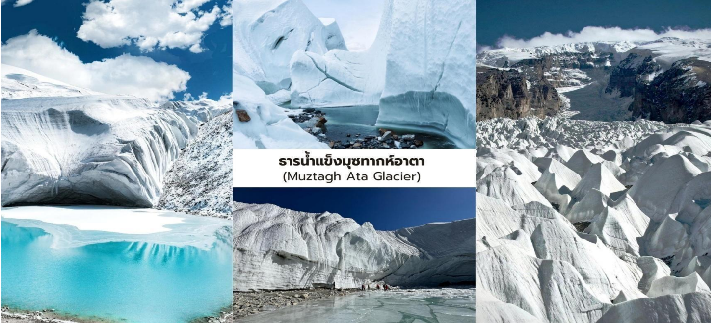
ธารน้ำแข็งมุขทากห้อตา (Muztagh Ata Glacier)

บ่าย นำท่านเที่ยวชม อุทยานธารน้ำแข็งมุขทากห้อตา (Muztagh Glacier Park Scenic Area, 慕士塔格峰) หนึ่งในภูมิทัศน์ธรรมชาติที่ยิ่งใหญ่ในเขตซินเจียง โดยมีฉากหลังเป็นภูเขามุขทากห้อตา (Muztagh Ata) หรือที่ได้รับสมญานามว่า “บิดาแห่ง เหล่าภูเขาน้ำแข็งทั้งมวล” (Father of Ice Mountains) ตั้งอยู่ในเทือกเขาปามีร์ มีความสูงประมาณ 7,546 เมตร เหนือระดับน้ำทะเลและถือเป็นหนึ่งในยอดเขาหิมะที่ยิ่งใหญ่ของภูมิภาค นำท่าน นั่งรถบัสของอุทยาน (รวมในรายการ) ลัดเลาะเข้าไปยังบริเวณเชิงเขาเพื่อชม ธารน้ำแข็งขนาดใหญ่ที่ไหลลงมาจากยอดเขา ท่ามกลางทัศนียภาพของภูเขาคิมะและทุ่งน้ำแข็งที่ทอดยาว สุดสายตาให้ความรู้สึกถึงความยิ่งใหญ่ของธรรมชาติบนที่ราบสูงปามีร์ระหว่างทางอาจพบกับจามรี (Yak) ที่อาศัยอยู่ ในพื้นที่ธรรมชาติของที่ราบสูงรวมถึงทิวทัศน์ภูเขาคิมะที่สวยงามเหมาะสำหรับการถ่ายภาพและชมธรรมชาติอันบริสุทธิ์