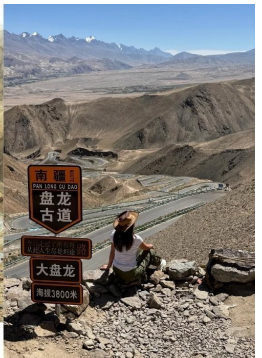
ถนนมังกรพันโค้ง/ผานหลง (Panlong Ancient Road)