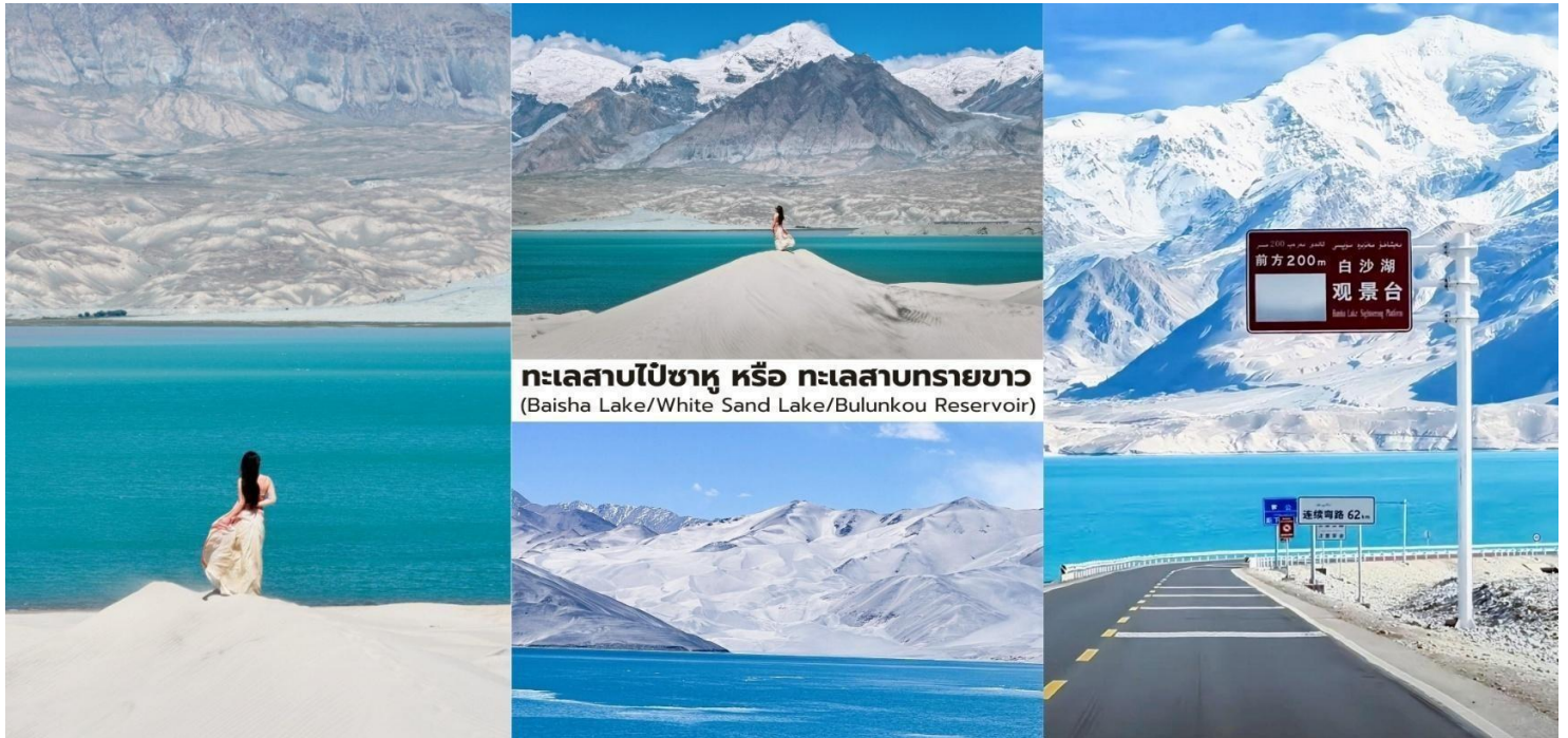
ทะเลสาบไปซาหู หรือ ทะเลสาบทรายขาว (Baisha Lake/White Sand Lake/Bulunkou Reservoir)

คำ บริการอาหารคำ ณ ภัตตาคาร ที่พัก Fengwuqi Hotel ระดับ 4* หรือเทียบเท่า