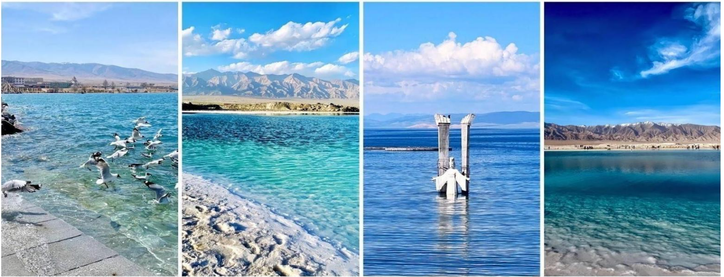
ทะเลสาบชิงไห่ (Qinghai Lake)

นำท่านเดินทางสู่ ทะเลสาบชิงไห่ ใช้เวลาเดินทางประมาณ 2 ชั่วโมง จากนั้นนำท่านชม ทะเลสาบชิงไห่ (Qinghai Lake, 青海湖) ที่ขึ้นชื่อว่าเป็นทะเลสาบน้ำเค็มที่ใหญ่ที่สุดในประเทศจีนและยังใหญ่เป็นอันดับต้นๆของเอเชีย โดยมีพื้นที่ประมาณ 4,657 ตารางกิโลเมตร ตั้งอยู่บนที่ราบสูงชิงไห่ทิเบตที่มีความสูงเหนือระดับน้ำทะเลประมาณ 3,196-3,200 เมตร ที่ตั้งของทะเลสาบแห่งนี้ได้ถูกรายล้อมไปด้วยเทือกเขาทั้งหมด 4 ลูกด้วยกัน ได้แก่ เทือกเขา Datong Mountain อยู่ทางทิศเหนือ, เทือกเขารือเยว่ Riyue Mountain อยู่ทางทิศตะวันออก, เทือกเขาชิงไห่ นานซาน Qinghai Nanshan Mountain อยู่ทางทิศใต้, เทือกเขาเซียงผี Xiangpi Mountain อยู่ทางทิศตะวันตก ชาวมองโกลเรียกทะเลสาบแห่งนี้ว่า คูกู นอร์ (Kökö Noor) ชาวทิเบตเรียกทะเลสาบแห่งนี้ว่า โซกอนโป (Tso Ngongpo) แต่ทั้งสองชื่อเรียกนี้ต่างก็มีความหมายว่า ทะเลสาบสีฟ้า แดงที่นี้ยังถือเป็น สถานที่ศักดิ์สิทธิ์ในพระพุทธศาสนาทิเบต ท่านจะได้ชื่นชมความงามของทุ่งหญ้าสีเขียวขจีอันกว้างใหญ่ซึ่งเป็นที่อยู่อาศัยของสัตว์ป่าและนกอพยพจำนวนมาก ตัดกับความงดงามของผืนน้ำสีฟ้า อันเข้มข้นและท้องฟ้าสีครามอันกว้างไกลบนที่ราบสูง จนที่นี่ได้รับการยกย่องว่าเป็น หนึ่งในทะเลสาบที่สวยงามที่สุดแห่งหนึ่งของประเทศจีน