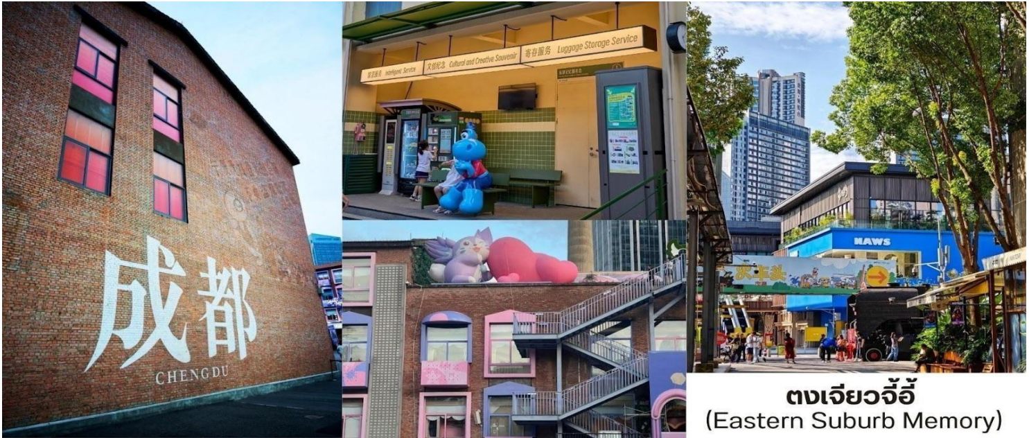
ตงเจี้ยวจี้ (Eastern Suburb Memory)

บาร์ & คราฟต์เบียร์ – ตอนเย็นบรรยากาศคึกคัก เหมาะกับการนั่งชิลฟังดนตรีสดอาหารเสฉวน ( Sichuan Food ) – ร้านอาหารท้องถิ่นจัดเต็มเมนูเผ็ดร้อน เช่น หม่าล่าหม้อไฟ เสฉวนสตรีทฟู้ด สตรีทฟู้ดสไตล์ครีเอทีฟ เช่น ไอศกรีม โฮมเมด ขนมอบ แชนด์วิซพิวซันและของกินเล่นที่เหมาะกับการเดินช้อปปิ้งเพลิน ๆ