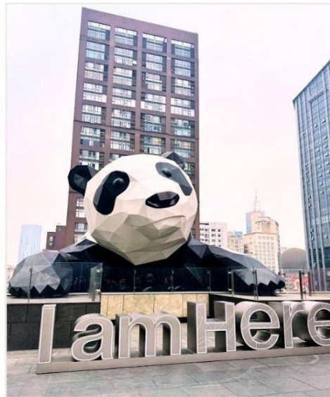
หมีแพนด้ายักษ์ กำลังปีนตึก IFS