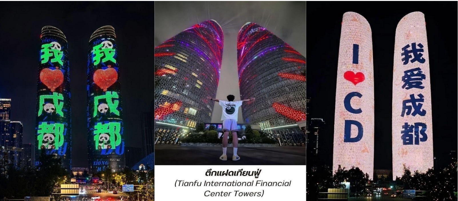
ตึกแฝดเทียนฟู (Tianfu International Financial Center Towers)

สมควรแก่เวลา นำท่านเดินทางกลับสู่โรงแรมที่พัก ระหว่างทางนำท่านแวะชมแสงสีถ่ายรูปลักษณ์นอก ตึกแฝดเทียนฟู (Tianfu International Financial Center Towers, 天府双塔) สัญลักษณ์แห่งความทันสมัยและความก้าวหน้าของเมืองเจียงตู ตึกระฟ้าแฝดแห่งนี้ตั้งตระหง่านอยู่ใจกลางย่านการเงินแห่งใหม่ ตึกแฝดเทียนฟูมีความสูงกว่า 220 เมตร แต่ละตึกมีดีไซน์ที่โฉบเฉี่ยวและเป็นเอกลักษณ์ โดยเฉพาะในยามค่ำคืน ตัวอาคารจะถูกประดับ ประดาด้วยไฟ LED ที่สว่างไสว ทำให้เกิดการแสดงแสงสีที่สวยงามตระการตา