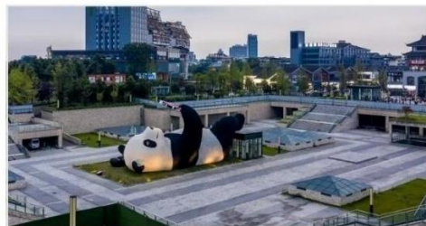
รูปปั้นแพนด้าเซลฟ์