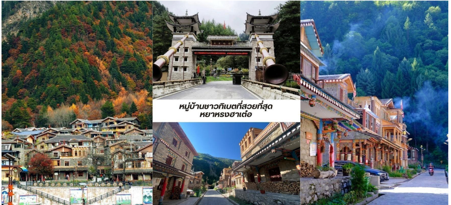
หมู่บ้านชาวทิเบตที่สวยงามที่สุด หย่าหงฮ่าเต๋อ