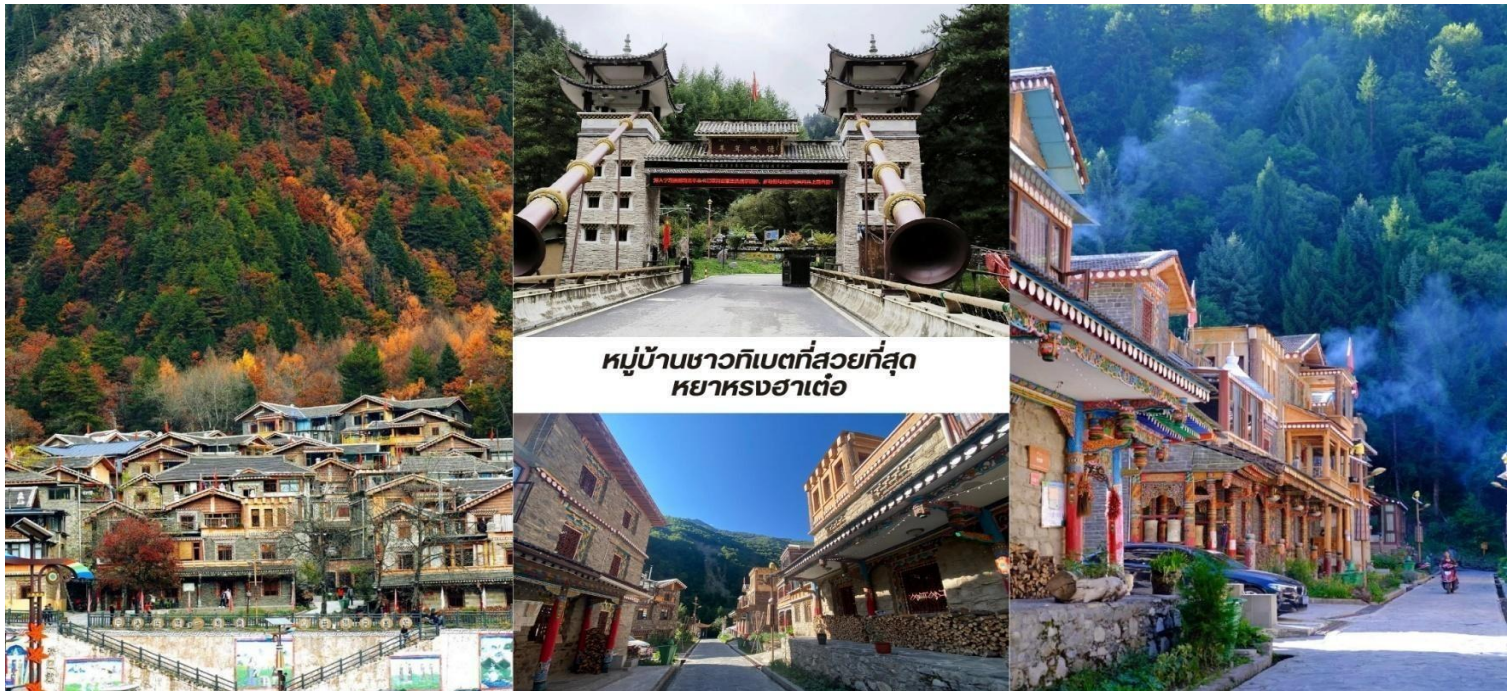
หมู่บ้านชาวทิเบตที่สวยงามที่สุด หย่าหงฮาเต๋อ

บ่าย นำท่านชม หมู่บ้านชาวทิเบตที่สวยงามที่สุด หย่าหงฮาเต๋อ (Yangrong Hades, 羊茸哈德) หมู่บ้านแห่งนี้เคยเป็นหมู่บ้านยากจนบนภูเขา แต่ด้วยการย้ายถิ่นฐานและพัฒนาการท่องเที่ยว ทำให้กลายเป็นจุดหมายปลายทางที่ดึงดูดนักท่องเที่ยวจากทั่วโลก ทัศนียภาพอันงดงาม หย่าหงฮาเต๋อล้อมรอบด้วยภูเขาสูงมีแม่น้ำเฮย์สุย (黑水河) ไหลผ่านและป่าไม้เขียวชอุ่มตลอดปี โดยเฉพาะในฤดูใบไม้ร่วง ป่าไม้จะเปลี่ยนเป็นสีสดใสของใบไม้เปลี่ยนสีทำให้ทั้งหมู่บ้านดูเหมือนอยู่ในภาพวาดอันงดงาม หมู่บ้านนี้ยังคงรักษาเอกลักษณ์วัฒนธรรมทิเบตดั้งเดิม ทั้งการ แต่งกาย อาหารท้องถิ่นและพิธีกรรมทางศาสนา หย่าหงฮาเต๋อ ไม่เพียงแต่เป็นสถานที่ท่องเที่ยวที่สวยงามเท่านั้น แต่ยังเป็นหมู่บ้านที่สะท้อนให้เห็นถึงการพัฒนาจากความยากจนสู่ความมั่งคั่งผ่านการผสมผสานการอนุรักษ์วัฒนธรรมดั้งเดิมกับการท่องเที่ยวได้อย่างลงตัว