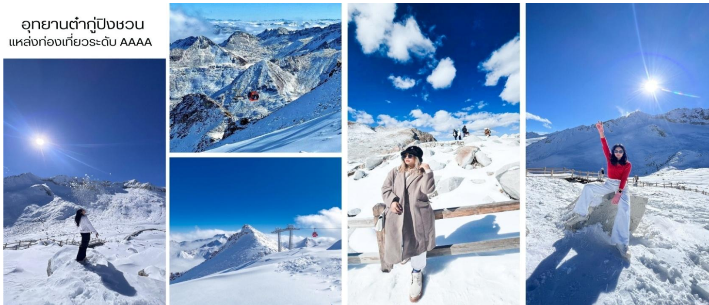
อุทยานต้ำกู่ปิงชว่น แหล่งท่องเที่ยวระดับ AAAA