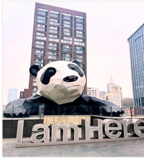
หมี่แพนด้ายักษ์ กำลังป็นตึก IFS