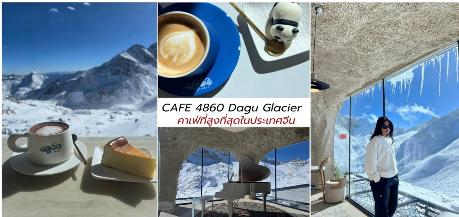
CAFE 4860 Dagu Glacier คาเฟ่ที่สูงที่สุดในประเทศจีน