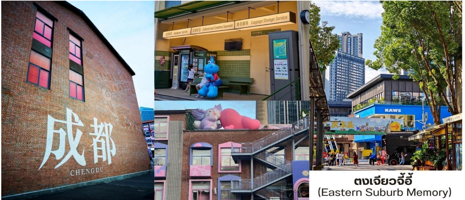
ตงเจียวจี้ (Eastern Suburb Memory)

นำท่านชม ชอยกว้างแคบ(Kuanzhai Alley, 宽窄巷子) เส้นหิมืองเก่าที่ผสมความทันสมัยใจกลางเจียงตุ ชอยกว้างแคบไม่ใช่แค่ถนนคนเดิน แต่เป็นย่าน ประวัติศาสตร์ ที่ได้รับการอนุรักษ์และปรับปรุงอย่างงดงามประกอบด้วยตรอกหลัก 3 สาย ที่ขนานกันไป โดยแต่ละตรอกสะท้อนบรรยากาศและบทบาทที่แตกต่างกัน ตั้งแต่สมัยราชวงศ์ซิงเมื่อ 300 กว่าปีก่อน จนถึงปัจจุบันย่าน ชอยกว้างแคบประกอบด้วย 3 ตรอก ได้แก่