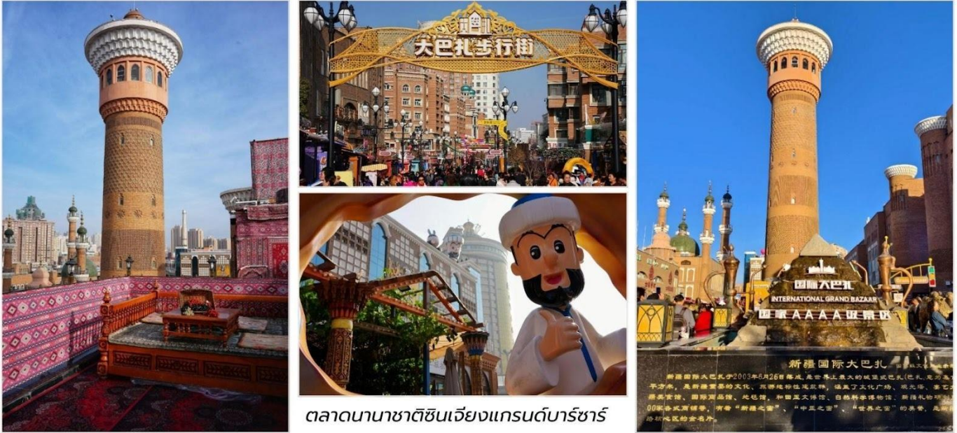
ตลาดนานาชาติซินเจียงแกรนด์บาร์ซาร์

บ่าย นำท่านเดินทางสู่ เมืองอุรุมชี (Urumqi, 乌鲁木齐) เมืองหลวงของเขตปกครองตนเองซินเจียง อุยกูร์ (Xinjiang Uyghur Autonomous Region) ตั้งอยู่ทางตะวันตกเฉียงเหนือของประเทศจีน ห่างจากชายฝั่ง ทะเลจีนกว่า 2,500 กิโลเมตรและได้รับการบันทึกโดย Guinness World Records ว่าเป็น “เมืองที่อยู่ไกลจาก มหาสมุทรที่สุดในโลก” แม้จะอยู่กลางแผ่นดิน แต่เมืองนี้กลับเต็มไปด้วยชีวิตชีวา สีสันของวัฒนธรรม และธรรมชาติที่งดงาม รอบตัวที่นี้คือ “หัวใจของซินเจียง” และจุดเริ่มต้นของการเดินทางสู่เส้นทางสายไหม (Silk Road) ที่เชื่อมโลกตะวันออกและตะวันตกเข้าด้วยกัน