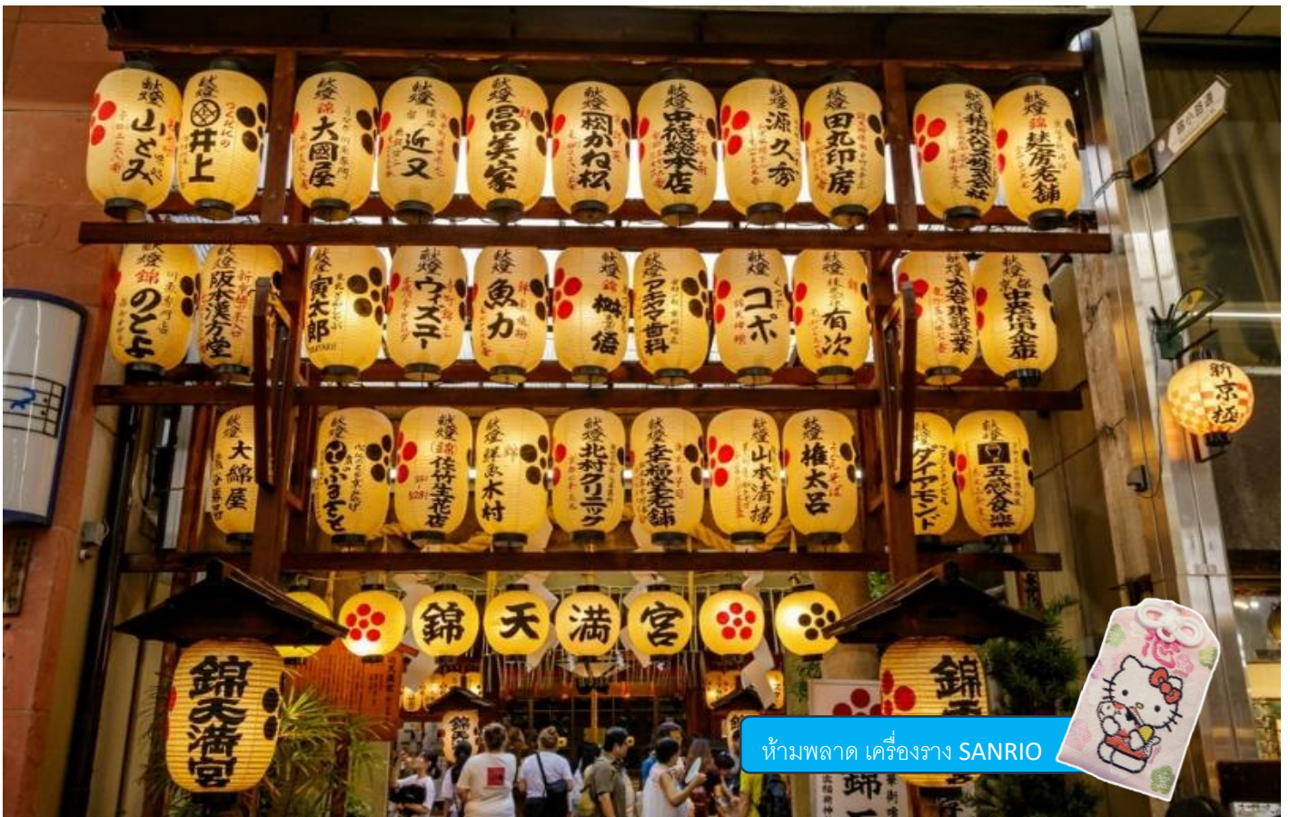
ห้ามพลาด เครื่องราง SANRIO

นำทุกท่านไปยัง ตลาดนิชิกิ (NISHIKI MARKET) ถือว่าเป็นตลาดที่ดังที่สุดในเมืองเกียวโต มีร้านค้าและร้านอาหารมากกว่า 100 ร้านค้าเรียงรายกันอยู่ เรียกได้เลยว่าเป็นตลาดที่รวมทุกอย่าง โดยเฉพาะของกินนานาชนิดไว้ให้เลือกอย่างละลานตา จนได้รับฉายานามว่า “KYOTO'S KITCHEN” ซึ่งแปลตรงๆ ได้ว่าครัวของเมืองเกียวโตนั่นเองค่ะ