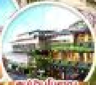
ชมพิพิธภัณฑ์ ตงเป๋น