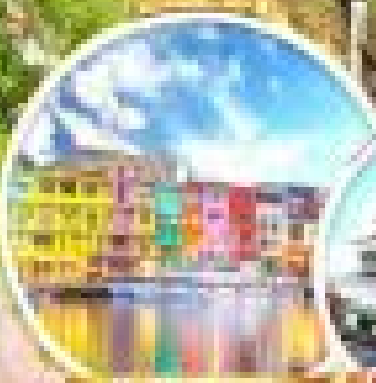
ถนนสีลมสวย