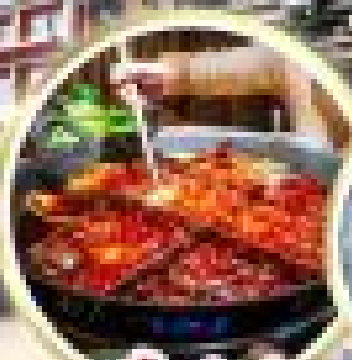
สุกี้พาสต้า