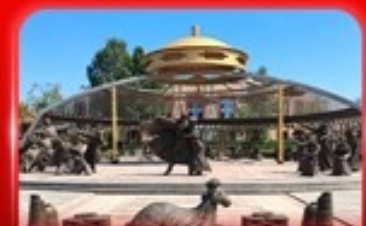
สวนวัฒนธรรมการแต่งจานจอร์ดอส