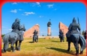
สวนสาธารณะเจงกิสข่าน