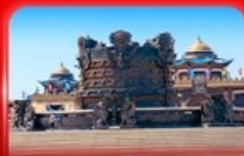
ศูนย์วัฒนธรรม มองโกเลีย หยวนหลิว