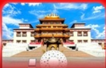
วัดพระโพธิสัตว์จุลาน